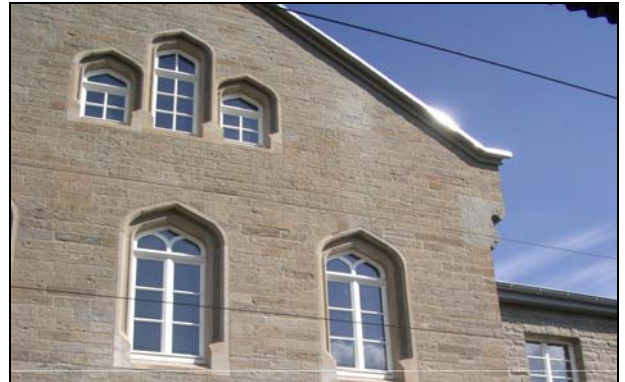
Fassadendetail nach der Sanierung